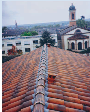
Hôpital de Montauban