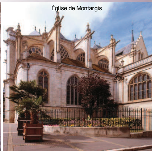
Église de Montargis

La société Pigeon Propre peut également vous proposer :