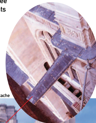
Église de St Eustache