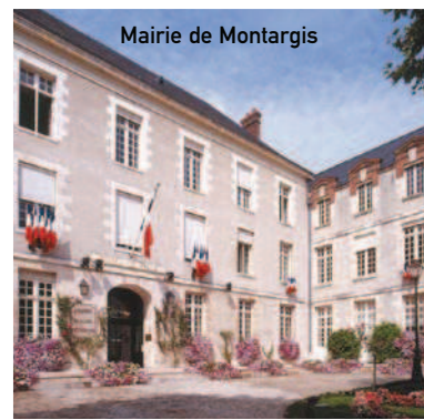
Mairie de Montargis